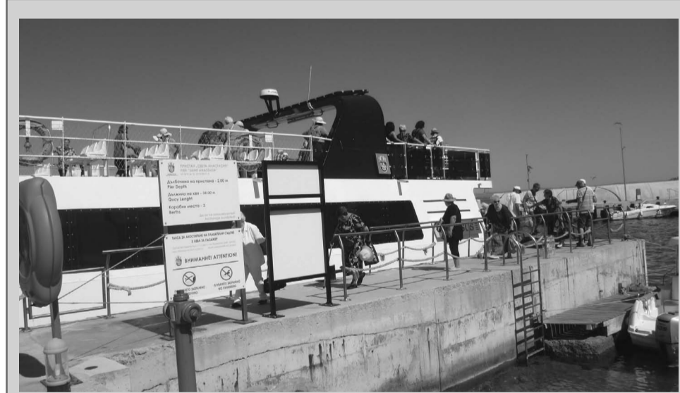
Участници в клубовете на учителите и на хората с увреждания от Твърдица посетиха Бургас и о-в „Света Анастасия“