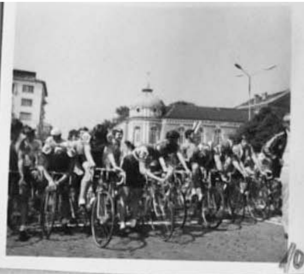
1981 г. Кадри от колоездачната обиколка на България, посветена на 1300 годишнината от основаването на Българската държава.