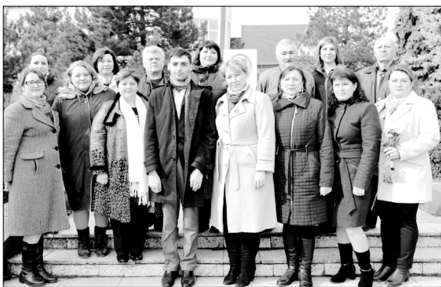
Трети март в Твърдица