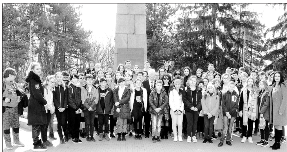
Трети март в Кишинев

Ще отбележа, че навсякъде в Република Молдова, където се проведоха тържествени мероприятия по случай националния празник на България,