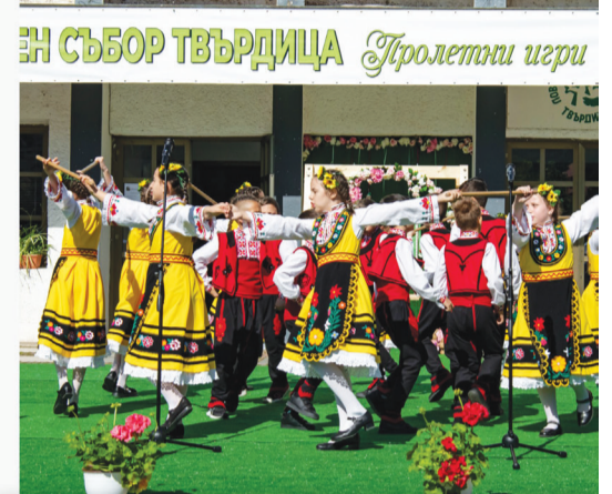
Фолклорен събор Твърдица Пролетни игри