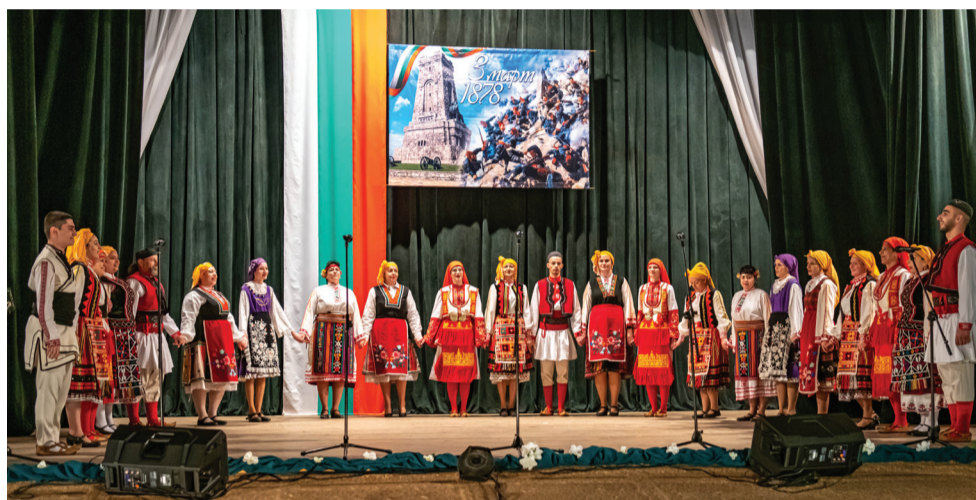
Празничен концерт за 3 март