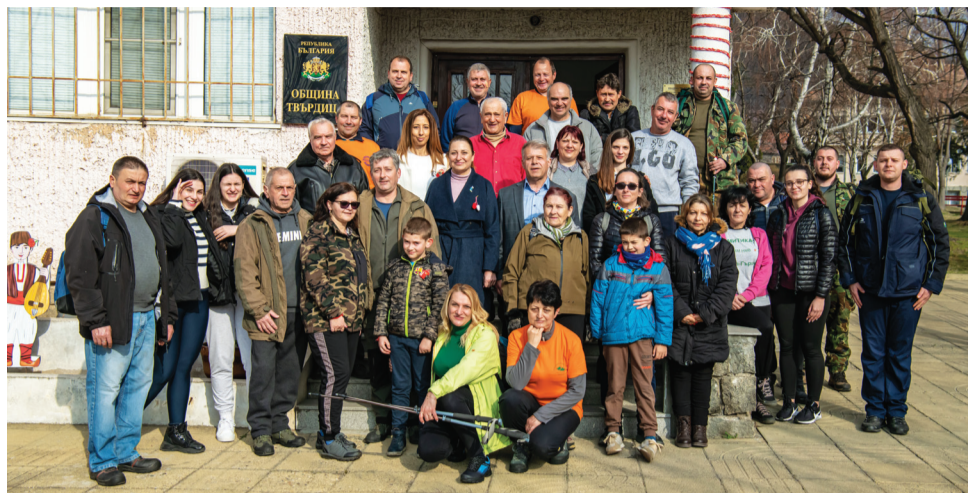
Снимка за спомен преди потегляне към връх Кутра