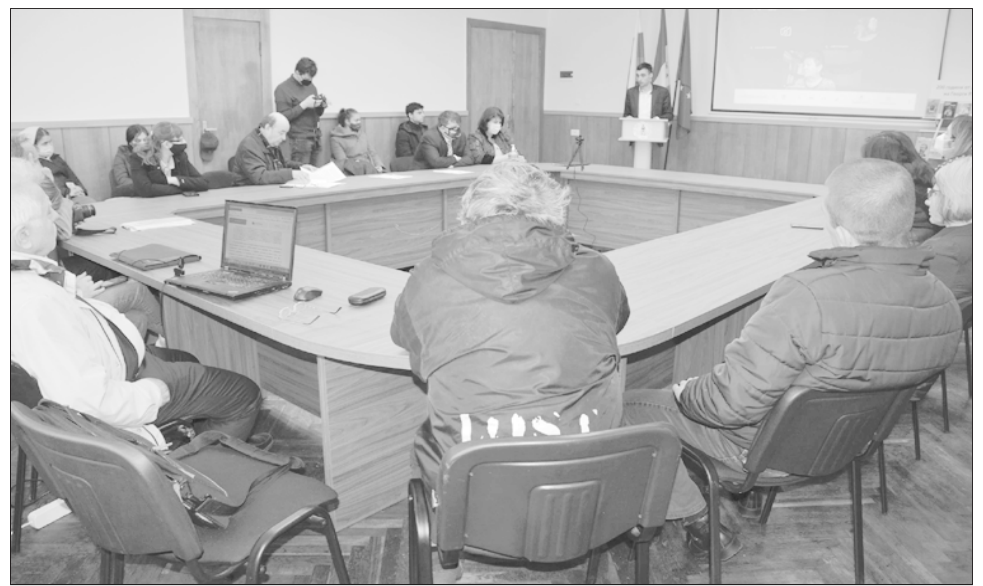
Кръгла маса в Тараклийския държавен университет

Остава да се надяваме, че в бъдеще родолюбивото дело на Георги Раковски все така ще се