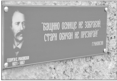
Мемориална плоча, открита в Тараклия

Известният деятел на българското националноосвободително движение Георги Раковски в своята родолюбива дейност е имал редица контакти и с бесарабските българи. Така, благодарение на негово съдействие през 1858 г. в Болград е открито Централното училище, което днес носи неговото име.