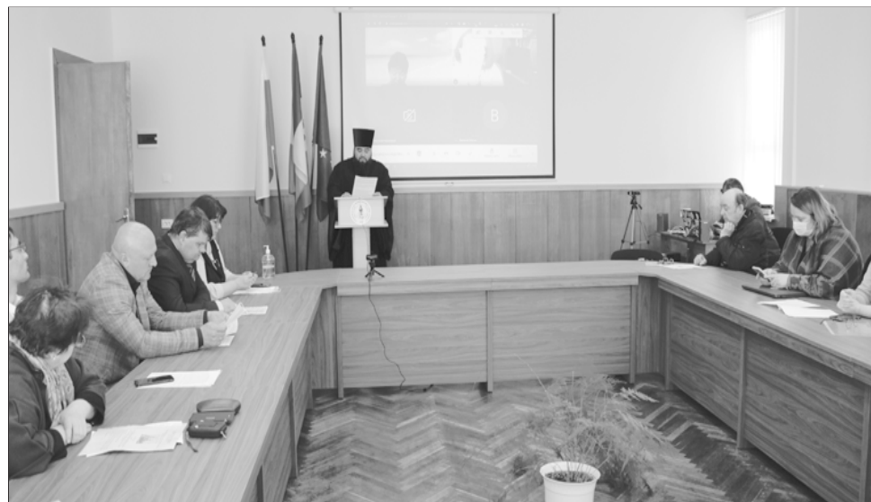
Научна конференция в Тараклийския държавен университет Григори Цамблак

град Тараклия на 5 май, в навечерието, когато на 6 май се отбелязва Денят на града и Денят на Свети Георги, чието име носи църквата в града. Сутринта на градското гробище беше открит реставрираният надгробен паметник на свещеник Сава Николаев, който е служил в Тараклия в периода 1930–1938 г. Открит е миналата година на градското гробище от