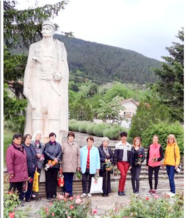
В чест на 2-ри юни – Ден на Ботев и на загиналите за свободата и независимостта на България, родолюбци от НЧ "Развитие - 1928" и ПК "Жарава" поднесоха цветя пред паметните плочи на героите в Козарево.