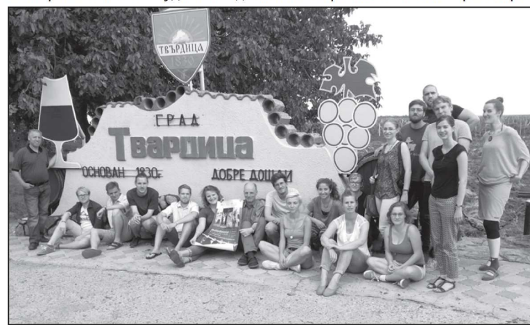
Немски студенти пред входа на града

памятника в чест на 100-годишнината на Твърдица, построен през 1930 г.