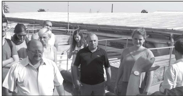
На посещение в свободната икономическа зона