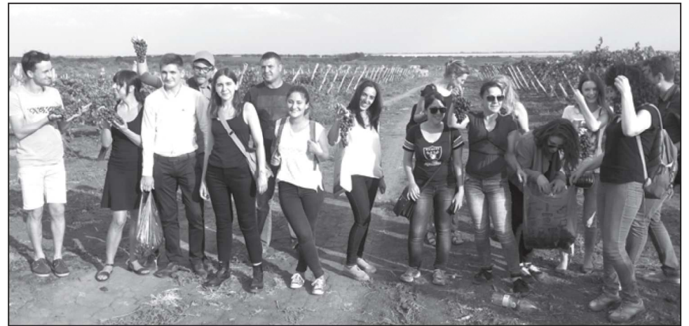
Студенти от Армения и Грузия оценяват твърдишко грозде